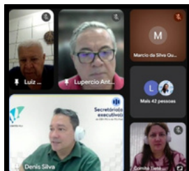
Legenda: 2ª Reunião Extraordinária do FPCBH - 14.10.2025